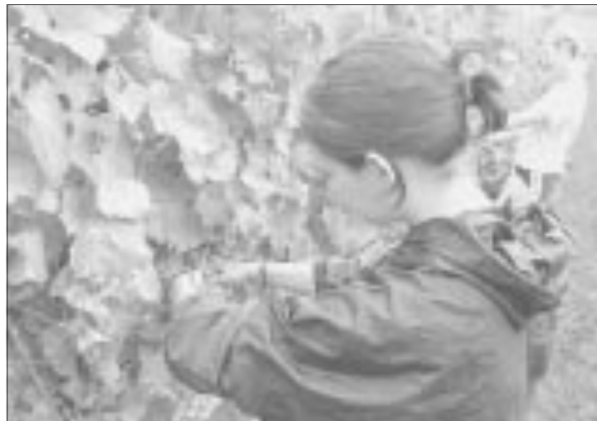
A giorni inizierà la vendemmia

Quest'annata inoltre, valorizzerà le peculiarità del territorio franciacortino il quale, nonostante non abbia una superficie complessiva elevata, presenta delle microaree molto diversificate che sono la premessa fondamentale per la creazione delle preziose cuvée Franciacorta.