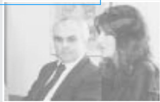
L'assessore Gelmini con il presidente Pè

confronto, nel corso del quale il presidente Pè e l'assessore Gelmini hanno concordato sulla necessità di mantenere viva la condivisione e lo scambio di informazioni, in un processo di collaborazione che, ha spiegato Pè, «è condizione essenziale per affrontare con la massima efficienza le problematiche che pesano su un settore determinante per l'agricoltura e le economie bresciane. Su questo fronte abbiamo particolarmente apprezzato la disponibilità dimostrata dall'assessore al confronto e alla concertazione».